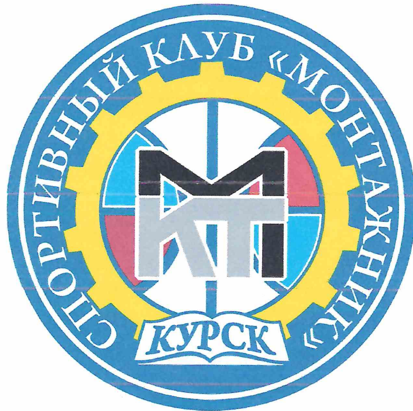
Рис.2 Флаг спортивного клуба «Монтажник» ОБПОУ «КМТ»